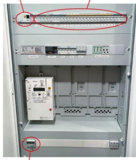
Vorzählersicherung / Tarifschalter